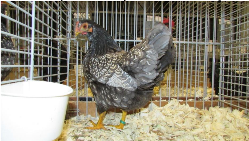
Een kriel hen in de nog te erkennen kleur zilver-blauw dubbelgezoomd van de heer B. Oskam.

In de open klasse waren ook een drietal zilver blauw dubbelgezoomd en een tweetal zilver parelgrijs dubbelgezoomd. Waarom deze dieren in de open klasse zaten en niet in de Vrije klasse bleef tijdens de show onduidelijk