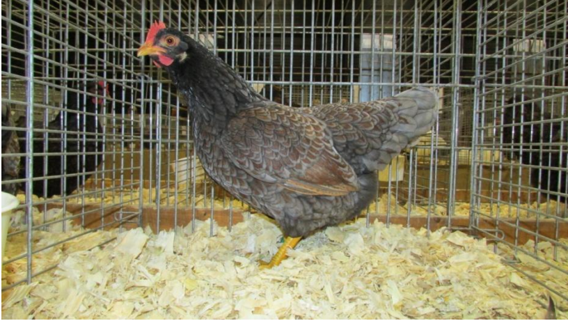
De winnende blauw dubbelgezoomd kriel hen van de heer B. Oskam

In zilver dubbelgezoomd drie hanen en tien hennen. Het is en blijft een prima kleuraanwinst die veel liefhebbers trekt maar ik had in de jaren na de erkenning meer vooruitgang verwacht. Als je de tekening van de haantjes vergelijkt met goud dubbelgezoomd en met de standaard dan zie je met name in hals- en schoudertekening nog (te) veel afwijkingen. De dieren zijn vrijwel allemaal te breed gezoomd en tonen daardoor te sterk getekend in de hals. In de hennen ook hier weer een aantal die niet de gevraagde zilvergrijze grondkleur laten zien maar een kleur die wat roestig aandoet. De binnenzoom in de borst is nog steeds een aandachtspunt en een behoorlijk aantal hennetjes laat op de schouders een dichtgelopen binnenzoom zien. In kooi 294 zat een hennetje wat er in positieve zin uitsprong. Zij liet een prima type zien en paarde dat aan een goede kleur en een prima tekening. Felicitaties voor B. vd Bruinhorst!