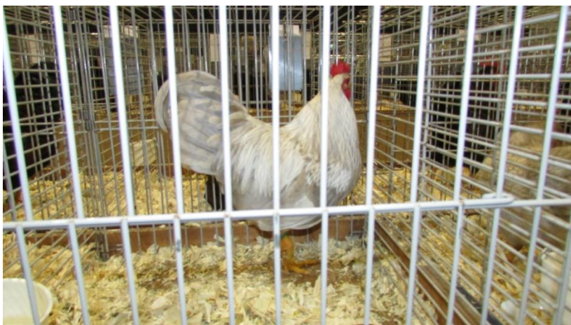
Een kriel haan in de nog te erkennen kleur zilver parelgrijs dubbelgezoomd van de heer B. Beugelsdijk

De haan en de hen in de zilver parelgrijze variant lieten een type zien wat tussen ZG en F ligt maar vragen nog aandacht v.b.t. tekening. Zeker de haan liet nog veel wensen noteren. Hij was overduidelijk te sterk gezoomd in hals en zadel.