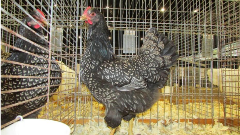
De winnende zilver dubbelgezoomde hen van de heer K. Blok

In de krielen kreeg ik een zevental blauw dubbelgezoomde dieren aangeboden. De staatopbouw van de krielen is traditioneel beter dan die van de grote variant. Daarentegen zijn er zeker bij de haantjes wat meer problemen met de vleugeldracht. Een aandachtspunt is de in 2018 op het keurmeesterscongres gemaakte afspraak over de onderlijn. Een correcte Barnevelder en Barnevelderkriel laat een stukje dijbeen zien. Hier ontbrak het bij een aantal dieren aan wat maakt dat je niet kunt starten met een F-type. Ook hier zien we ene wat rodere grondkleur dan idealiter het geval zou moeten zijn. De tekeningkleur was bij een enkele haan wat donker met name in de staart. De winnaar in deze groep was een prima hennetje van Bas Oskam die inmiddels al heel wat jaren een volhouder is in deze moeilijke kleurgroep.