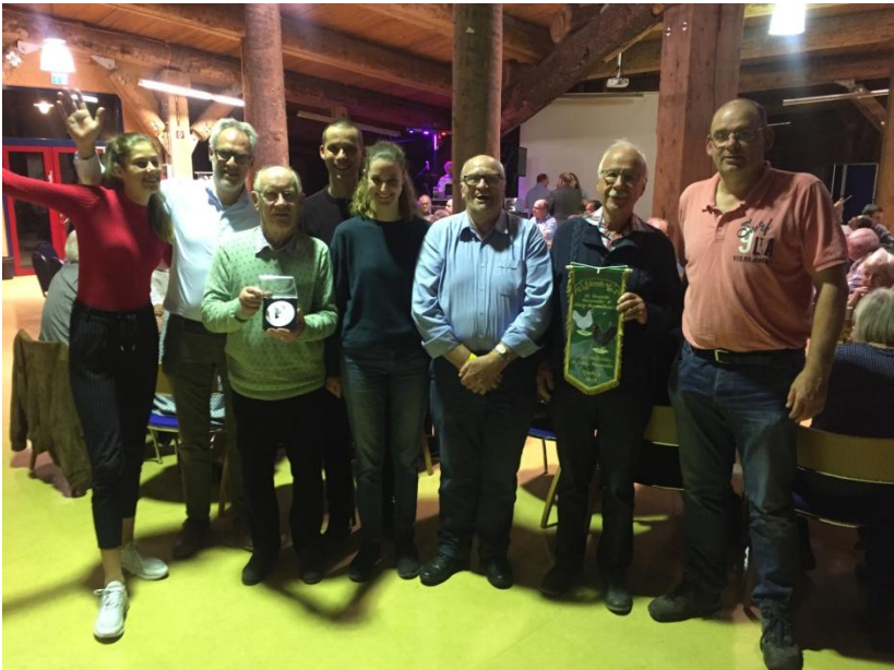
1Alle Nederlandse deelnemers.

In Duitsland is de hoofdshow (Hauptsonderschau) veel meer dan alleen het showen van dieren; het is een sociaal gebeuren. De deelnemers, die vaak vele honderden kilometers rijden, gaan na het inkooien niet naar huis maar blijven in de buurt van de show overnachten. Dit jaar sliepen wij in de kamers van de agrarische school van Nienburg (D). De partner en soms ook de kinderen gaan mee naar de show. Naar de show gaan is een klein feestje. De leden van de vereniging drinken voor de show een biertje met elkaar, gaan samen een museum bezoeken tijdens de keuring en uitgebreid dineren tijdens de prijsuitreiking .