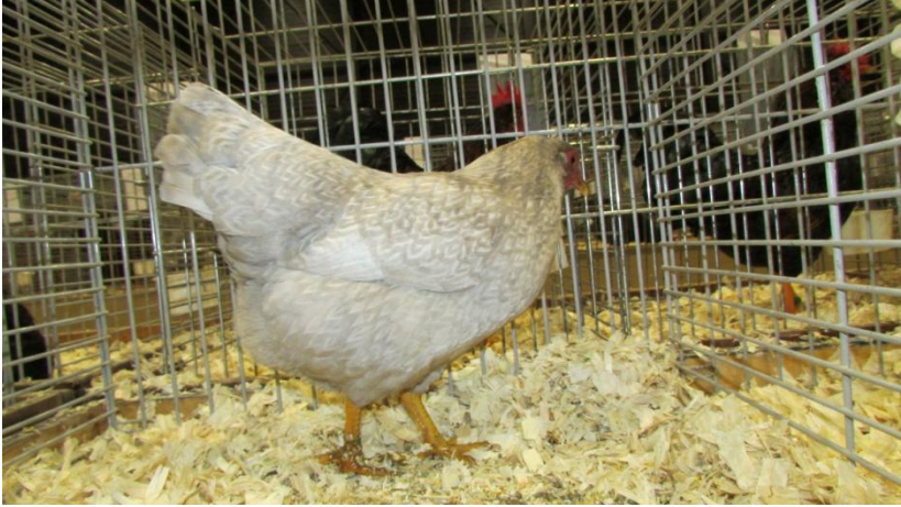
Een kriel hen in de nog te erkennen kleur zilver parelgrijs dubbelgezoomd van de heer B. Beugelsdijk.

Wat ik mij naast het bovenstaande wel herinner is een goed verzorgde show in een prima gebouw met een hele mooie winnaar van de show, een dubbelgezoomde krielhen van hoge kwaliteit (Helaas was dit hennetje niet van een van onze leden Red).