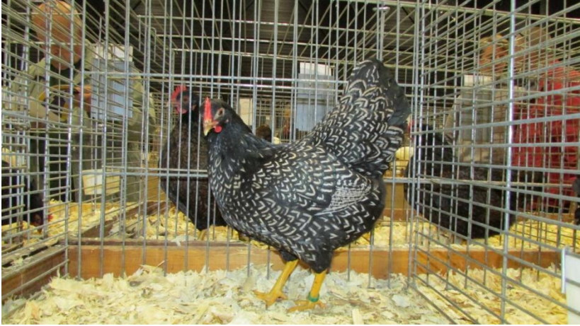
De winnende zilver zwart dubbelgezoomde kriel hen van de heer B. van de Bruinhorst

In de open klasse waren ook een drietal zilver blauw dubbelgezoomd en een tweetal zilver parelgrijs dubbelgezoomd. Waarom deze dieren in de open klasse zaten en niet in de Vrije klasse bleef tijdens de show onduidelijk