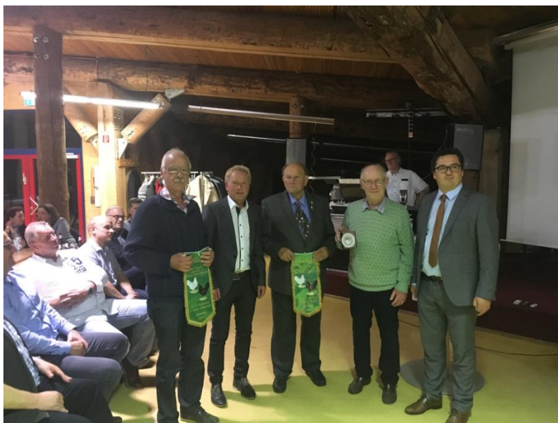
De prijs uitreiking